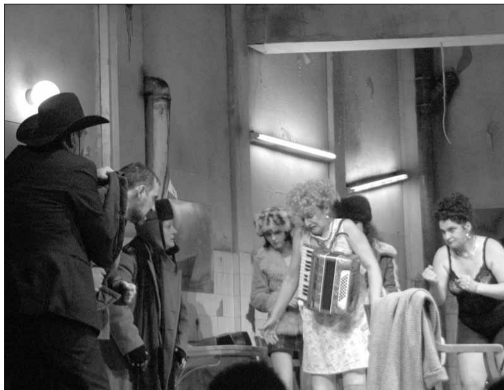
Scenă din Audiția , Teatrul Național „Vasile Alecsandri,, Iași